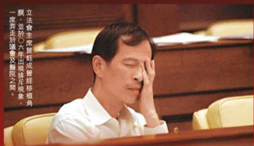
立法會主席曾鈺成曾接受角膜移植手術，並於○六年出現排斥現象，一度弄至失明及醫院之間。

換內皮細胞康復快 趙先生說，由於全片換，眼球縫了二十幾針，術後除了要每日滴消炎藥水外，眼睛亦感不適，像有東西「銀」住的感覺。而由於角膜沒有血管，故生長癒合較慢；另外為了調節散光，故