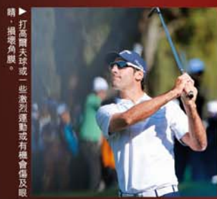
▶ 打高爾夫球或一些激烈運動或有機會傷及眼，損壞角膜。