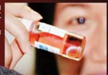
捐出的眼角膜存在粉紅色保存液內，會在一星期內移植。

有意在身故後捐出角膜人士，可以簽署器官捐贈卡，獅子會眼庫會在捐贈者身故後主動聯絡家屬，在獲得同意後才會由醫護人員摘除捐贈者的眼組織。角膜取出後，會被置放在粉紅色的保存液內，以保持其質素優良，並會在一星期內移植，每位捐贈可以有最少兩人受惠，如逐層移植，可以有更多人受惠。