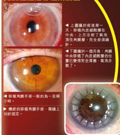
◀ 上圖攝於術後第一天，移植內皮細胞層在中央，上方注射了氣泡頂住角膜層，完全毋須縫針。 ◀ 下圖攝於一個月後，角膜中央移植了內皮細胞層的位置已變得完全清晰，氣泡亦散了。 ▶ 移植角膜手術一般約為一至兩小時。 ▶ 傳統的移植角膜手術，需縫上16針固定。