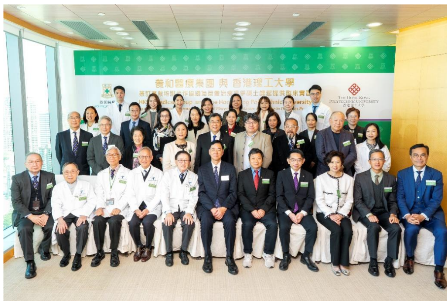
5. 养和医疗集团与香港理工大学签订专业培训合作协议全体嘉宾合照。

Department of Food Science and Nutrition 食品科學及營養學系