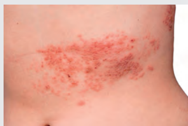
▲腹部皮膚生蛇也可能令病人肚痛。