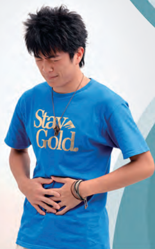
▶ 男士腹痛，有機會是「小腸氣」。