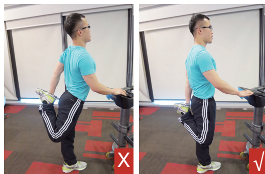
大腿前四頭肌伸展