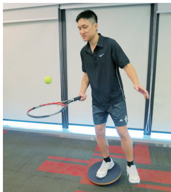
足踝關節本體感覺訓練