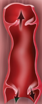
單向瓣膜出現問題，導致血液倒流

靜脈是體內血液循環系統的一個重要部份。當動脈將血液供應至身體各部位後，靜脈則將血液送回心臟。如靜脈內的單向瓣膜出現問題，導致血液倒流及循環欠佳，靜脈便會變得脹大及扭曲，出現靜脈曲張，俗稱「浮腳筋」。