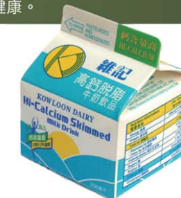
▲ 一盒（236毫升）脫脂奶只有87卡路里，比一杯橙汁低卡。

「每天飲用牛奶不但能補充鈣質，而且它含高蛋白質，飲用後有飽滿感，熱量亦比果汁低，所以牛奶絕對是有益飲品！」