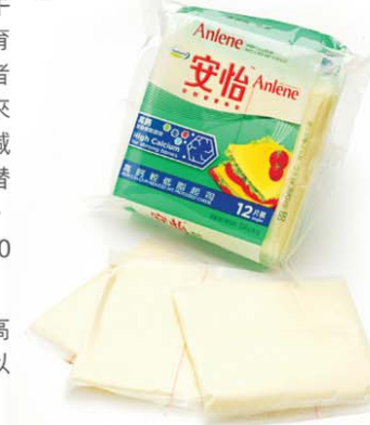
▼ 吃芝士，最好選低脂或脫脂芝士。